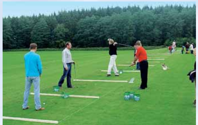
Betrieb auf der Driving Range