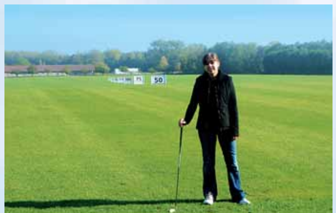
Unsere Driving Range