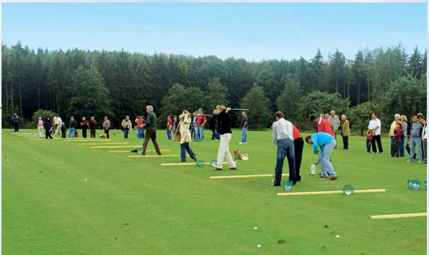
Unsere Driving Range wurde am 2. Oktober 2006 eröffnet