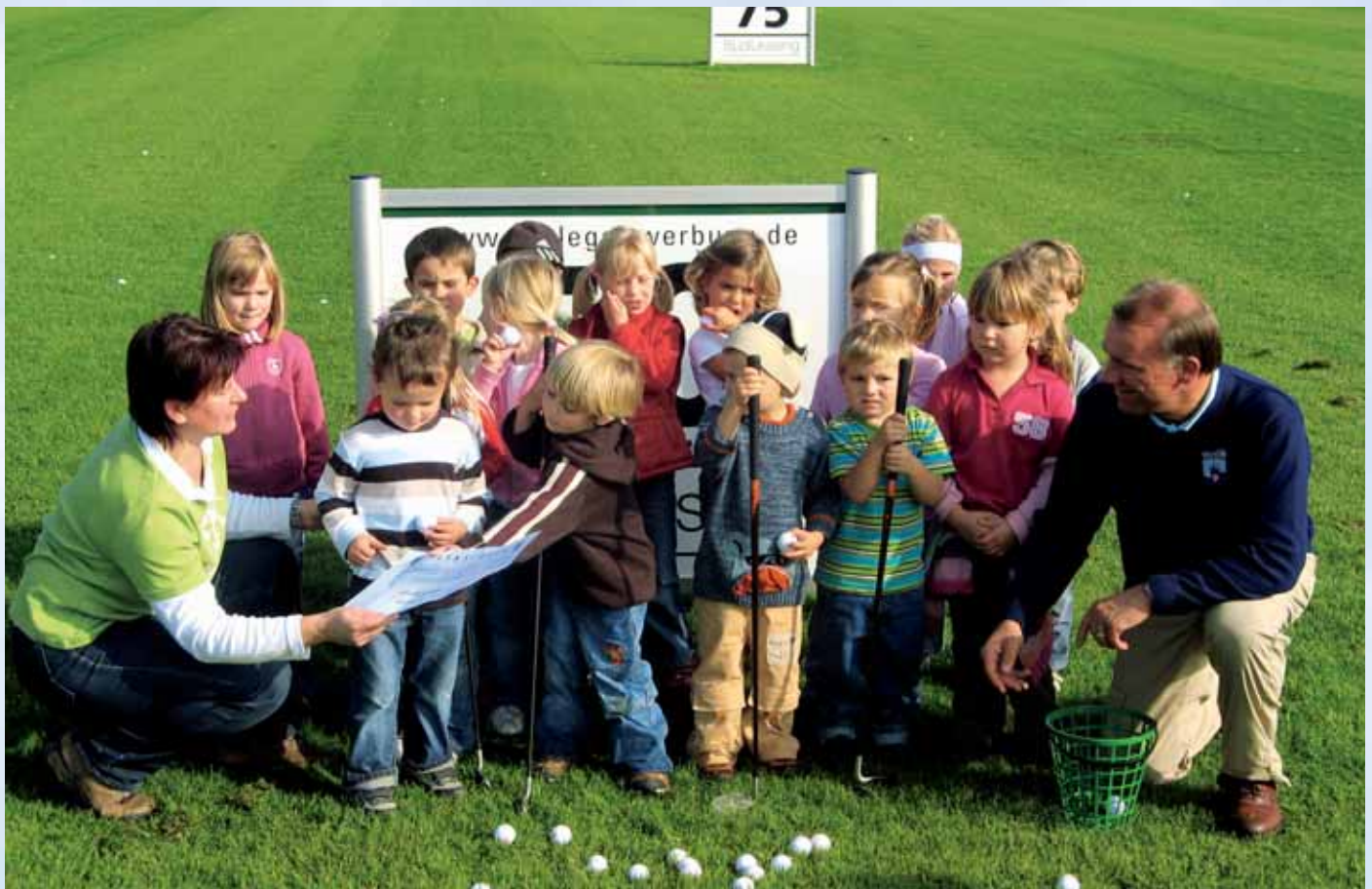
Der Kindergarten Rißtissen zu Besuch auf unserer Driving Range