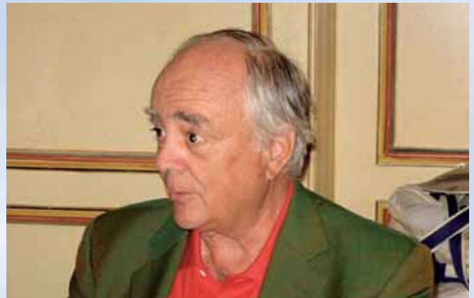
Robert Trent Jones jr.

Sehr kurze Anfahrtswege für Golfspieler aus Laupheim (4 km) und EHINGEN (8 km).