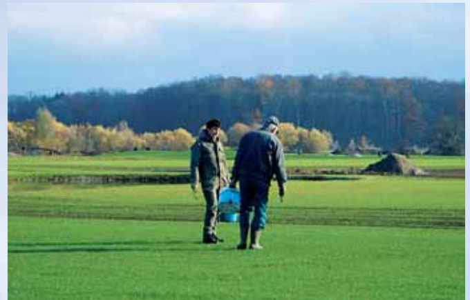
Unsere Greenkeeper im Einsatz

Für unseren Golfclub konnten wir überregional tätige Firmen gewinnen. Diese werden uns bei den Investitionskosten unterstützen. Darüber hinaus werden diese Sponsoren auch sehr interessante Turniere auf unserer Anlage ausrichten. Die Planungen für das zweite Halbjahr 2007 laufen bereits. Wir sind sicher, dass sowohl unsere Mitglieder als auch unsere Gäste von diesen Turnieren begeistert sein werden.