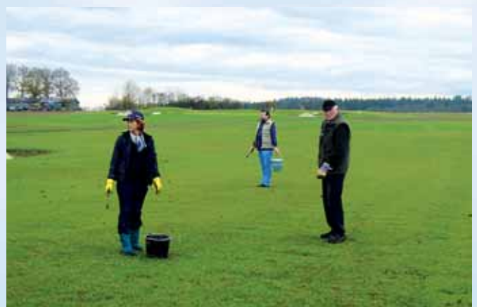
Steine sammeln auf dem Golfplatz