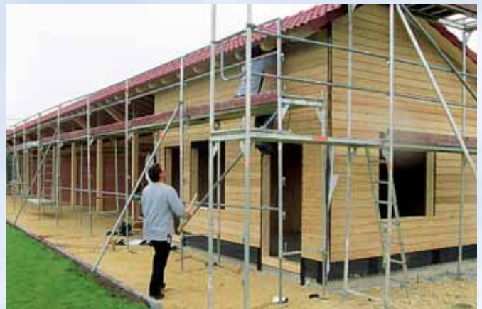
Bau des Abschlaghauses auf der Driving Range